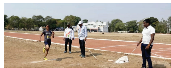
■ सुपा : प्रतिनिधी